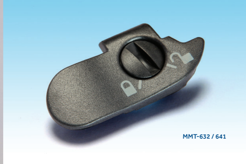
MMT-632 / 641