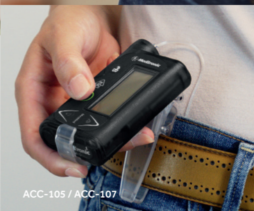
ACC-105 / ACC-107