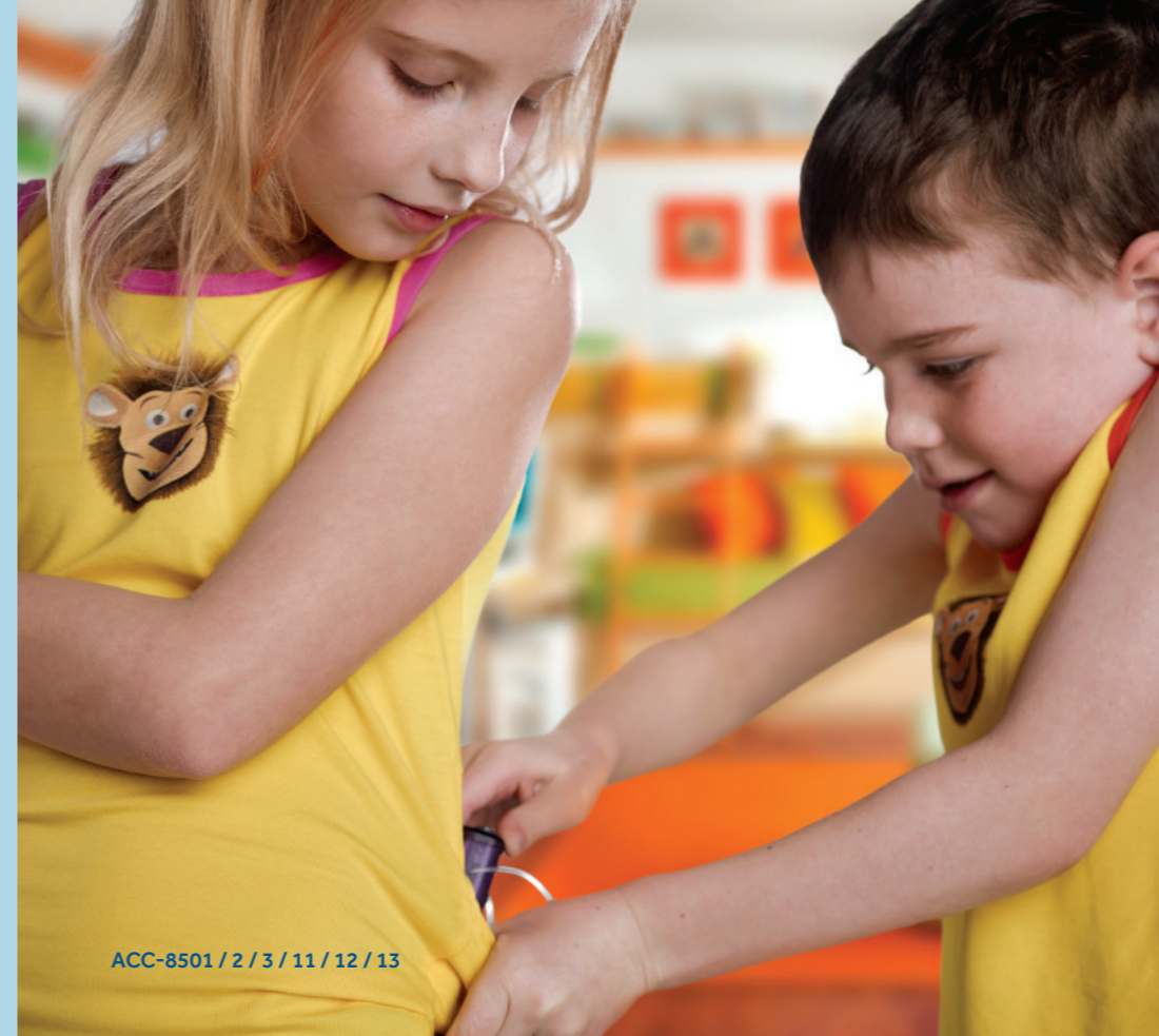
ACC-8501 / 2 / 3 / 11 / 12 / 13