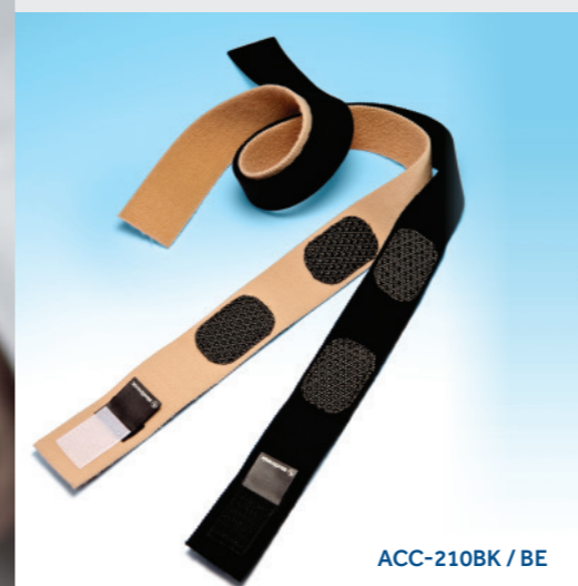
ACC-210BK / BE