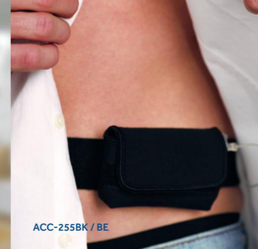
ACC-255BK / BE