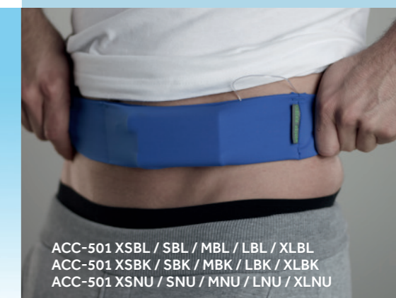
ACC-501 XSBL / SBL / MBL / LBL / XLBL ACC-501 XSBK / SBK / MBK / LBK / XLBK ACC-501 XSNU / SNU / MNU / LNU / XLNU