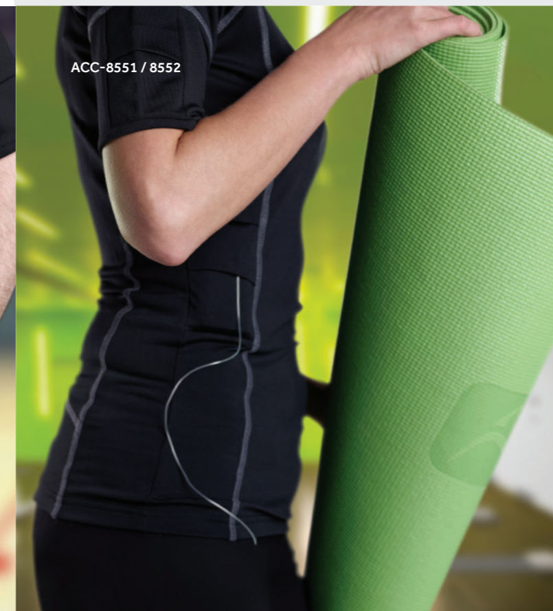
ACC-8551 / 8552