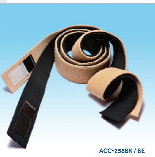
ACC-258BK / BE