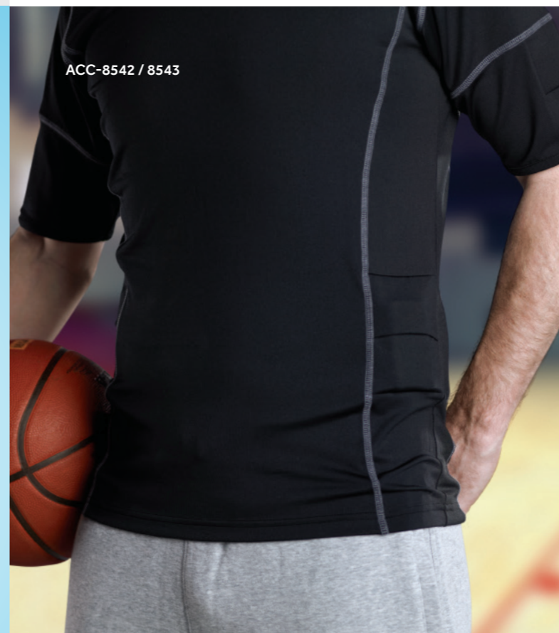
ACC-8542 / 8543