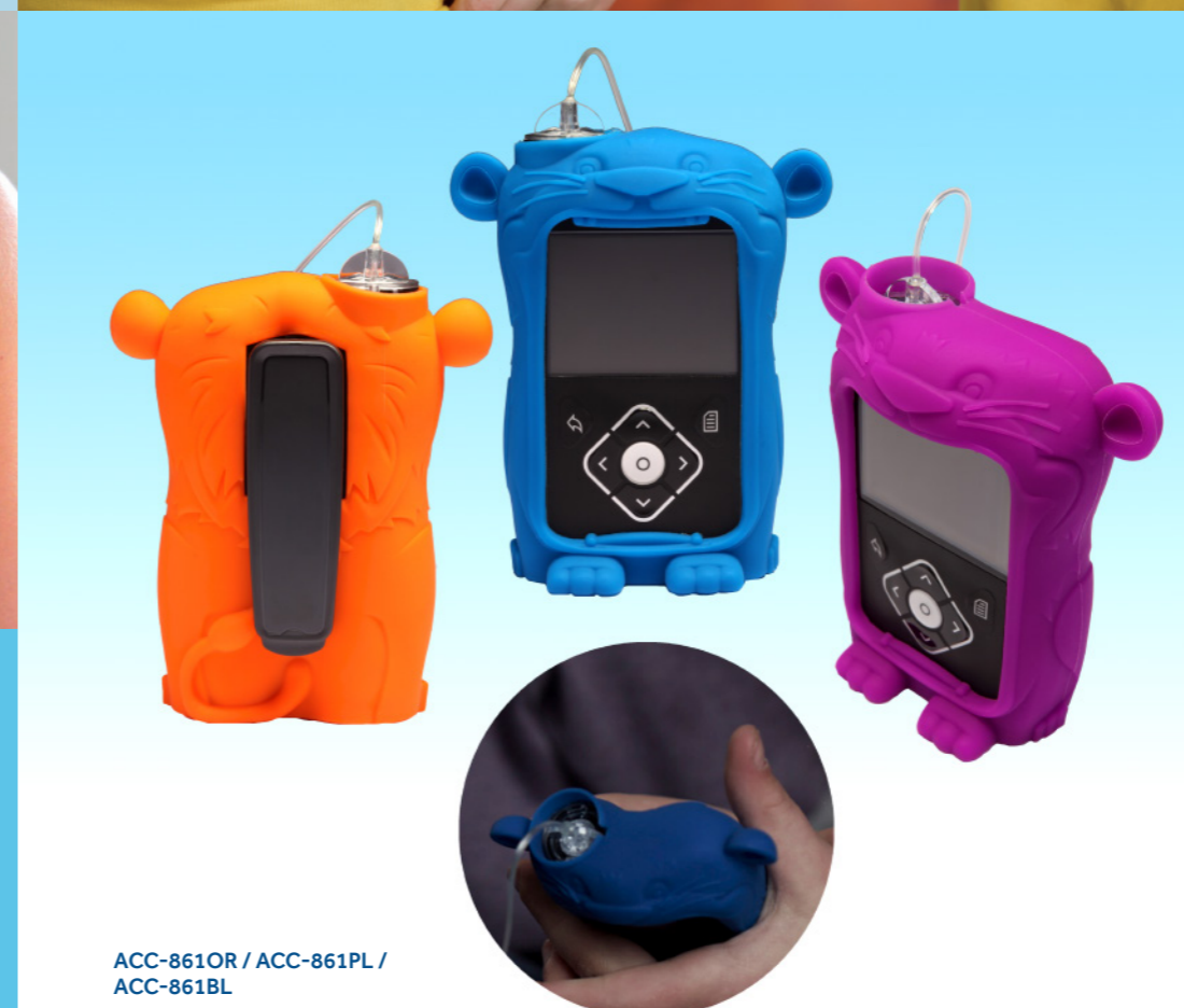
ACC-861OR / ACC-861PL / ACC-861BL