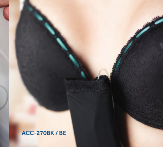
ACC-270BK / BE